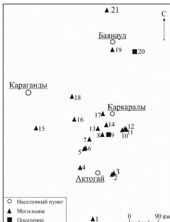
Рисунок 1 – Расположение памятников, проанализированных в данной работе.

Для анализа были использованы образцы костей 27 человек из 27 курганов и трех животных (два из поселений, один из кургана) тасмолинской культуры из 30 памятников Центрального Казахстана (рис. 1). По результатам радиоуглеродного анализа, проведенного ранее, образцы датируются VIII–V вв. до н.э. [24; 25], как и тасмолинская культура в целом.